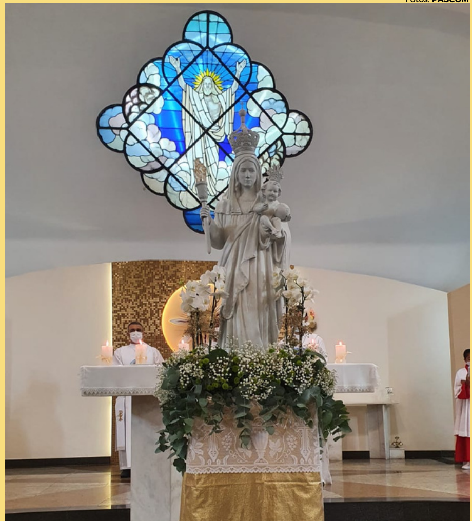
Imagem de Nossa Senhora da Luz durante homenagem na novena esse ano